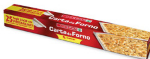
CARTA FORNO DESPAR 25 FOGLI