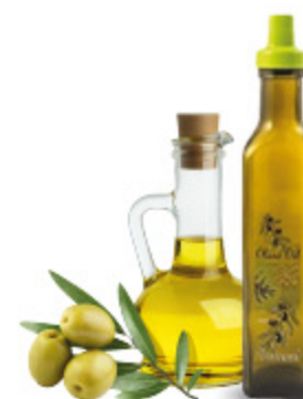
OLIERA IN VETRO VERDE CON TAPPO PENGO 0.5L