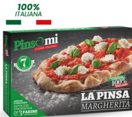
LA PINSA MARGHERITA PINSAMI 370G