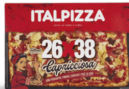
PIZZA CAPRICCIOSA 26X38CM ITALPIZZA 585G