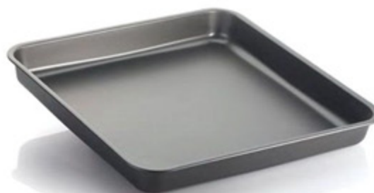
TEGLIA QUADRA HAPP.STONE FRIGGITRICE AD ARIA 20X20CM