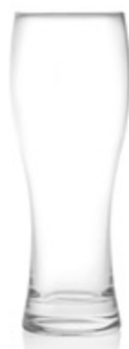
BICCHIERE IN VETRO WEIZEN BIRRA 33CL