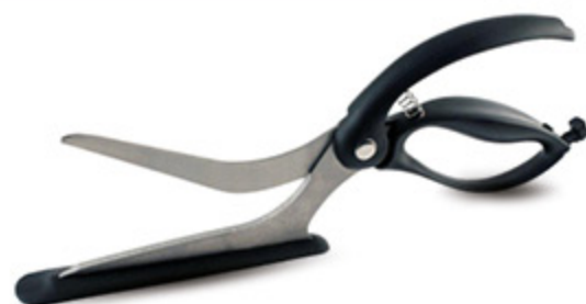
FORBICE TAGLIAPIZZA M/NERO 31.5CM