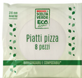
PIATTI PIZZA BIODEGRADABILI E COMPOSTABILI DESPAR SCELTA VERDE ECO,LOGICO X8