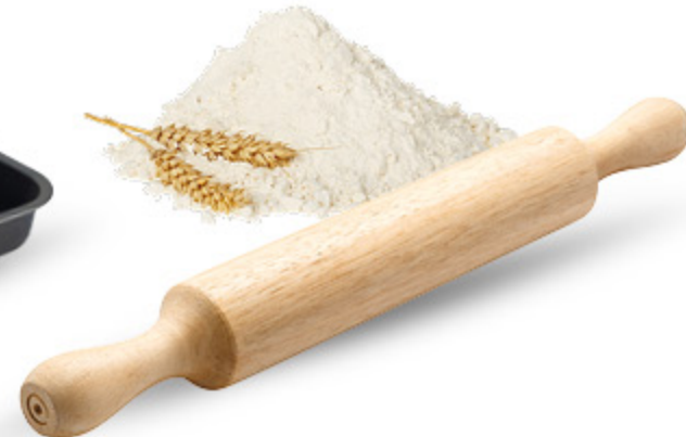
MATTARELLO HOME LEGNO FAGGIO 40CM