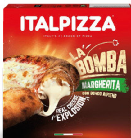
PIZZA MARGHERITA LA BOMBA ITALPIZZA 440G