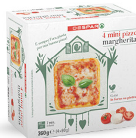
PIZZETTE MARGHERITA DESPAR X4