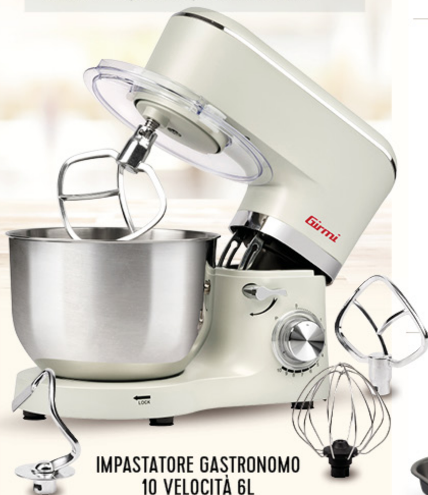
IMPASTATORE GASTRONOMO 10 VELOCITÀ 6L 1500W