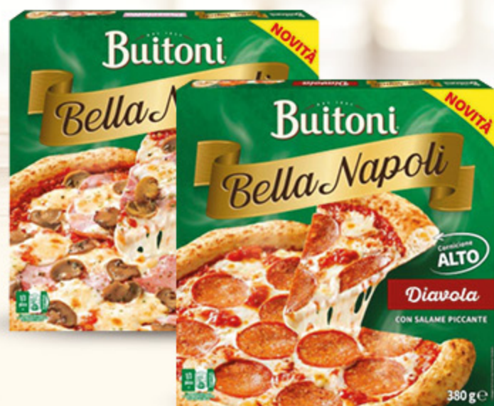
PIZZA BELLA NAPOLI BUITONI DIAVOLA/ PROSCIUTTO E FUNGHI 380G