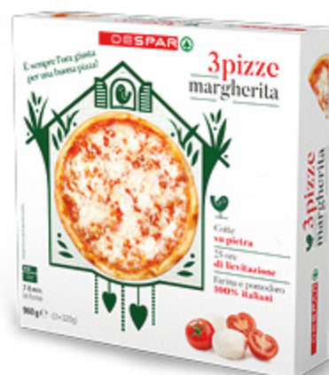
PIZZA MARGHERITA DESPAR 320G X3