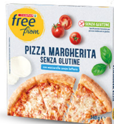
PIZZA MARGHERITA DESPAR FREE FROM 340G