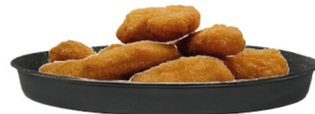
TORTIERA TONDA FRIGGITRICE AD ARIA 20X4,5CM/20X7CM