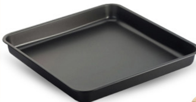
TEGLIA PIZZA 35X34X4,2H