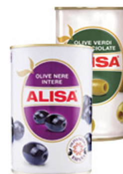
OLIVE ALISA NERE/VERDI DENOCCIOLATE 340G/INTERE VERDI 425G