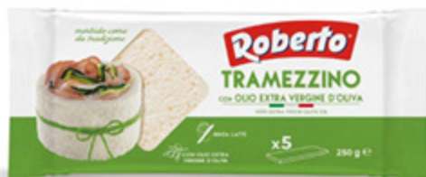
PANE PER TRAMEZZINO ROBERTO 250G