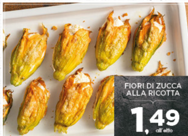
FIORI DI ZUCCA ALLA RICOTTA