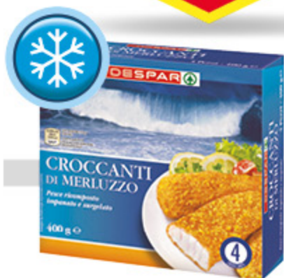
Croccanti di merluzzo DESPAR 400g

ieri, oggi, domani. Siamo sempre convenienti.