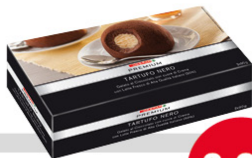
Tartufo nero PREMIUM 180g