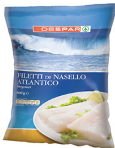
FILETTI DI NASELLO DESPAR 800G