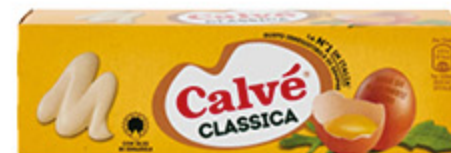
MAIONESE CLASSICA CALVE' TUBO 150ML