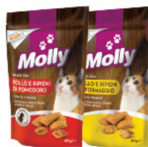
SNACK DI POLLO MOLLY CON FORMAGGIO/ POMODORO 60G