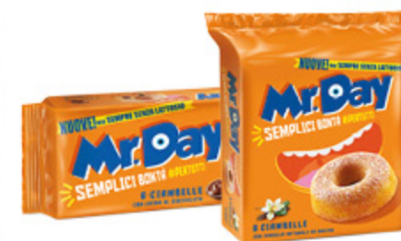
CIAMBELLE MR. DAY CLASSICHE 300G/ CIOCCOLATO 320G