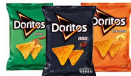
DORITOS BBQ /CHILI/ TEX MEX 140G