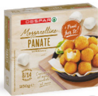
MOZZARELLE PANATE DESPAR 250G