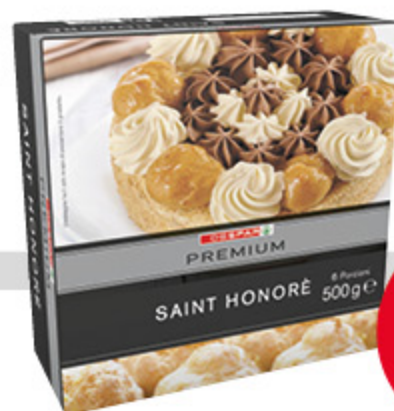
Torta saint honore PREMIUM 500g