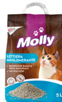
Lettiera agglomerante bentonite bianca MOLLY 5l