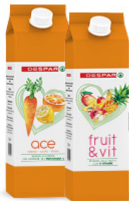
SUCCHI DESPAR VARI TIPI 1,5L