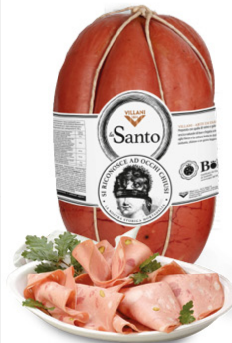
MORTADELLA BOLOGNA IGP LA SANTO VILLANI