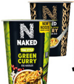
NOODLES CUP/ RICE CURRY VARI TIPI 78G