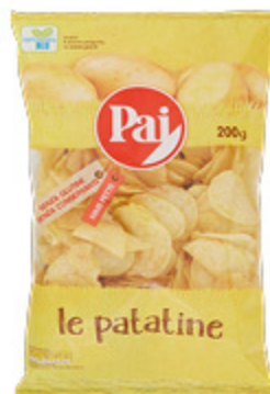
PATATINE PAI 200G