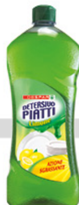
Detersivo piatti DESPAR limone 1l