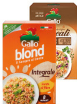
RISO GALLO BLOND INTEGRALE 500G/ 3 CEREALI/ 3 CEREALI INTEGRALE 400G