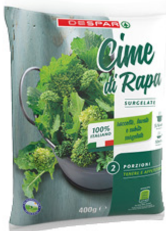
CIME DI RAPA DESPAR 400G