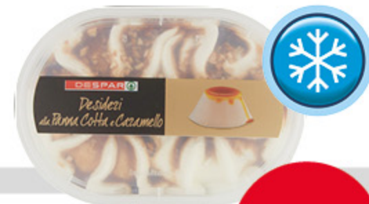
Vaschetta gelato DESPAR sorbetto al limone 200g