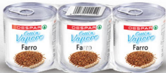
FARRO COTTO A VAPORE DESPAR 150G X3