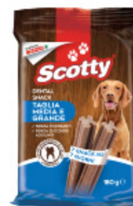
DENTAL SNACK SCOTTY 7PZ 180G