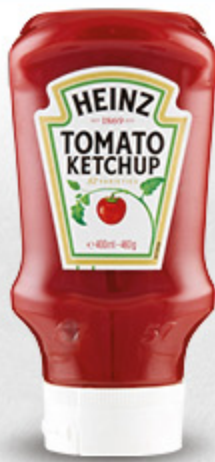
KETCHUP TOP DOWN HEINZ 460G