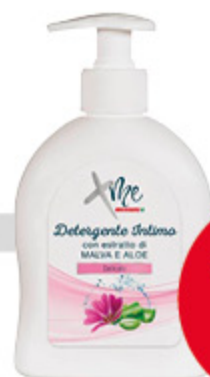
Detergente intimo XME delicato 300ml