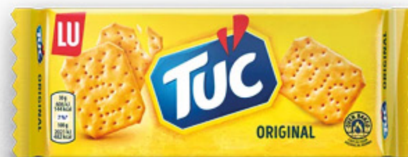
TUC SAIWA ORIGINAL 100G