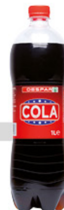
Bibita cola DESPAR regular 1l