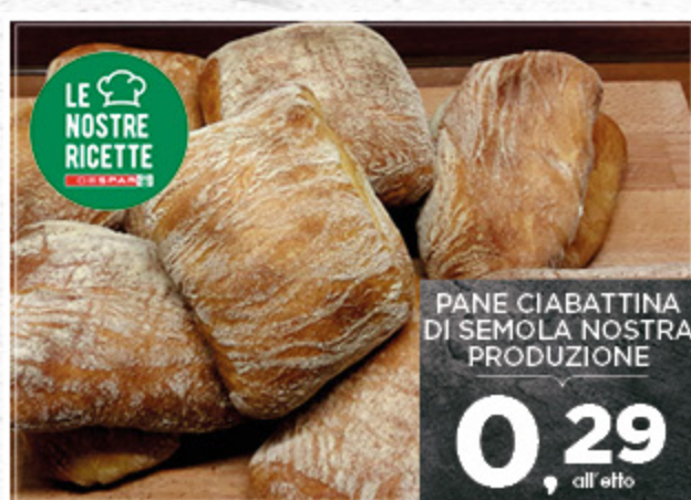
PANE CIABATTINA DI SEMOLA NOSTRA PRODUZIONE