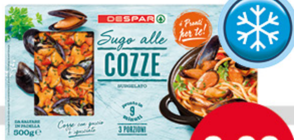
Sugo alle cozze DESPAR 500g