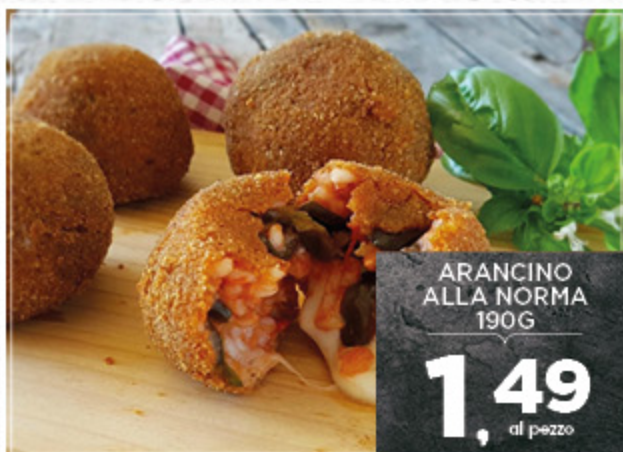
ARANCINO ALLA NORMA 190G