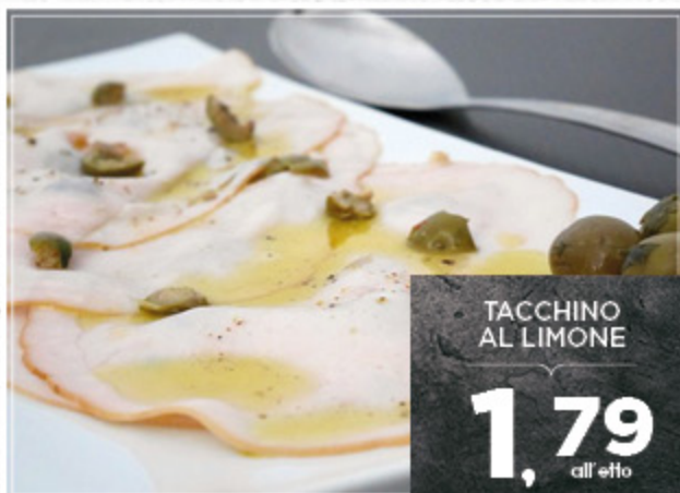
TACCHINO AL LIMONE