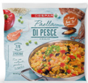
PAELLA DI PESCE DESPAR 650G