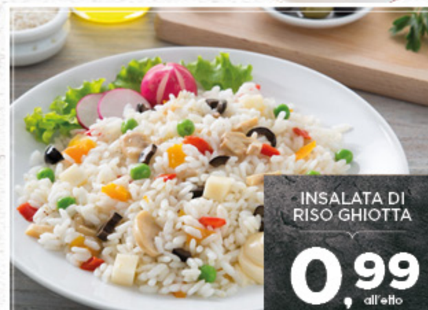
INSALATA DI RISO GHIOTTA