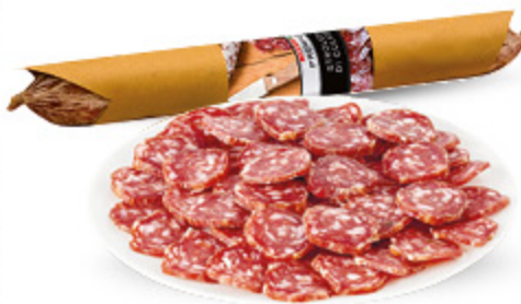
SALAME STROLGHINO PREMIUM