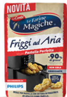
PASTELLA FRIGGITRICE AD ARIA LOCONTE 300G