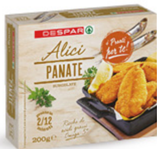
ALICI PANATE DESPAR 200G