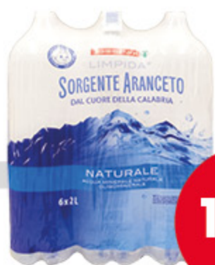
Acqua DESPAR 2l x 6 bottiglie