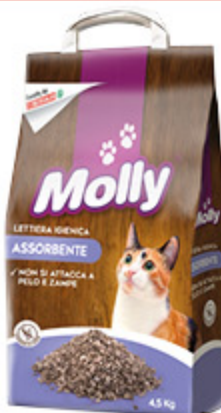
LETTERA PER GATTI DESPAR MOLLY 5L