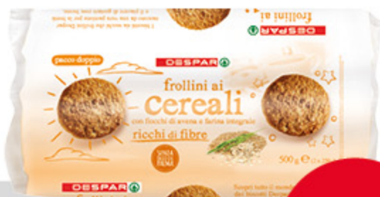
Frollini ai cereali DESPAR 500g