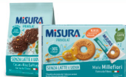
BISCOTTI PRIVOLAT MISURA VARI TIPI 290G/400G