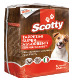
TAPPETI SUPER ASSORBENTI SCOTTY 60X60 X10PZ