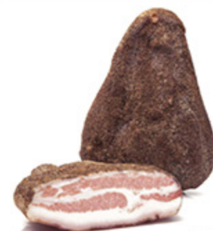
GUANCIALE DI NORCIA AL PEPE/ PEPERONCINO LANZI