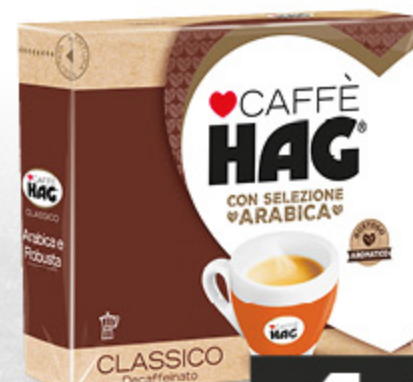
CAFFÈ HAG CLASSICO 250G X2