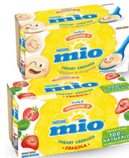
YOGURT MIO NESTLÉ VARI TIPI 125G X2