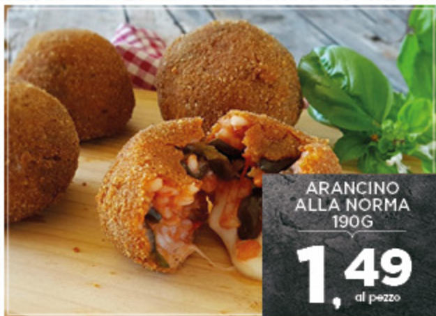
ARANCINO ALLA NORMA 190G