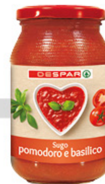
Sugo Despar pomodoro e basilico 400g