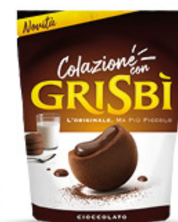
COLAZIONE CON GRISBI AL CIOCCOLATO 250G