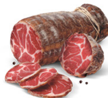
CAPOCOLLO PUGLIESE GOURMET STORIE DI GUSTO