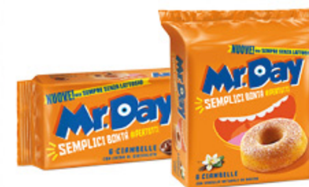
CIAMBELLE MR. DAY CLASSICHE 300G/ CIOCCOLATO 320G