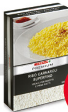
Riso carnaroli Premium 1kg