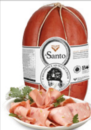
MORTADELLA BOLOGNA IGP LA SANTO VILLANI