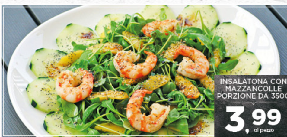
INSALATONA CON MAZZANCOLLE PORZIONE DA 350G