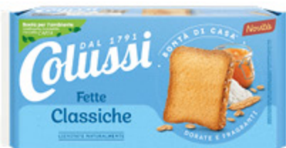
FETTE BISCOTTATE COLUSSI 425G