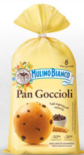
PAN GOCCIOLI MULINO BIANCO 336G