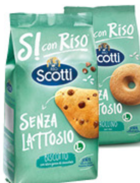
BISCOTTI SI CON RISO SENZA LATTOSIO SCOTTI VARI TIPI 350G