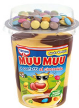
MUU MUU + CONFETTI AL CIOCCOLATO CAMEO 125G