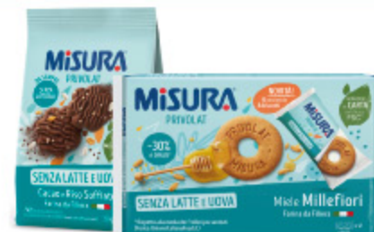
BISCOTTI PRIVOLAT MISURA VARI TIPI 290G/400G