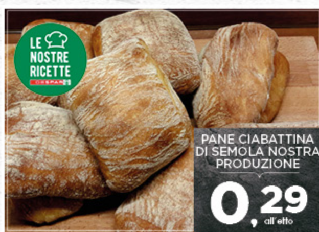
PANE CIABATTINA DI SEMOLA NOSTRA PRODUZIONE