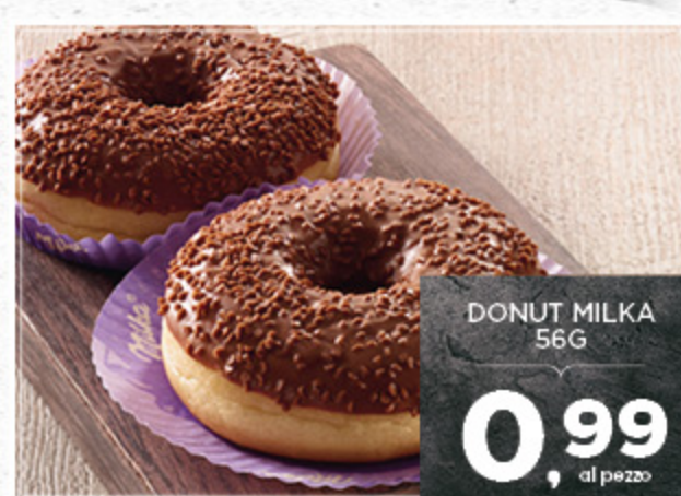
DONUT MILKA 56G