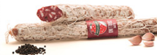
SALAME CORALLINA SALUMIFICIO SORRENTINO