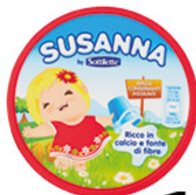
FORMAGGINI SUSANNA 140G