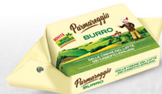
BURRO PARMAREGGIO 200G