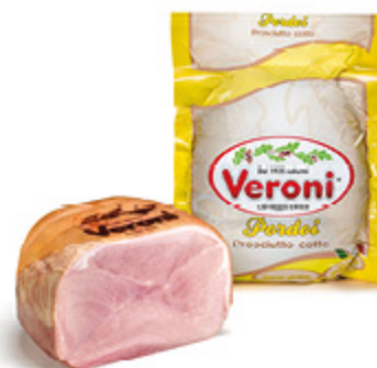
PROSCIUTTO COTTO PORDOI VERONI