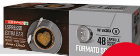
Caffè Despar espresso extra bar 48 caps

Ieri, oggi, domani. Siamo sempre convenienti.