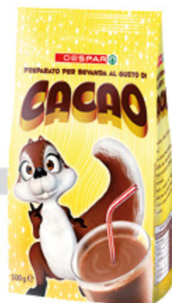
Preparato per bevanda al cacao Despar 500g