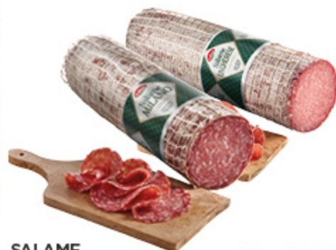
SALAME MILANO/ UNGERESE GALBANI