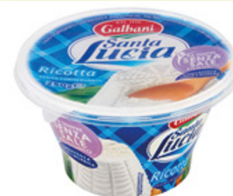
RICOTTA SANTA LUCIA GALBANI 250G