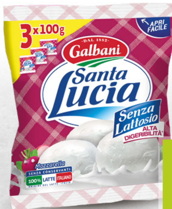
MOZZARELLA SENZA LATTOSIO SANTA LUCIA 100G X3