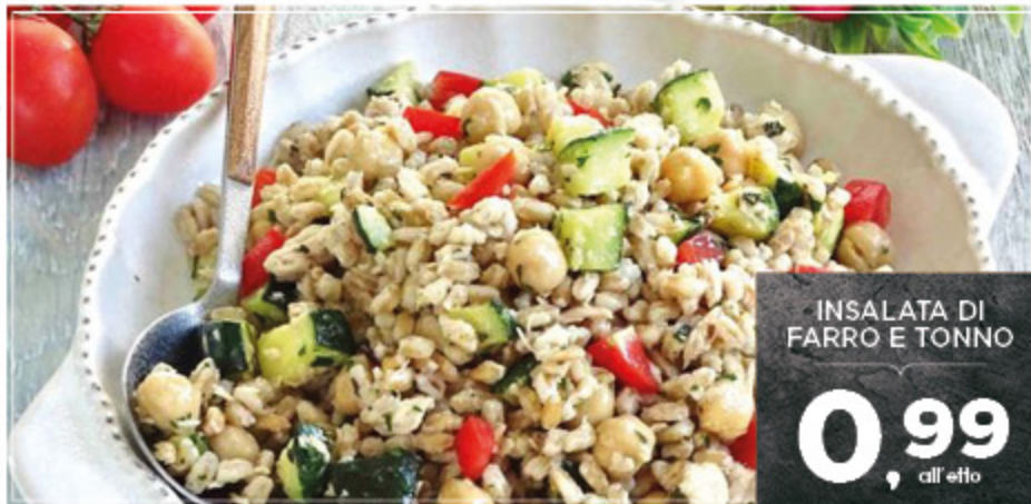
INSALATA DI FARRO E TONNO