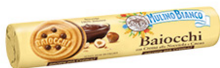
BAIOCCHI ALLA NOCCIOLA MULINO BIANCO 168G