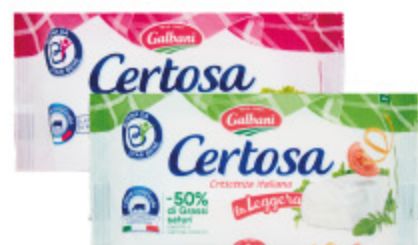
CERTOSA GALBANI LIGHT/SENZA LATTOSIO 165G