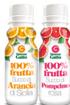
SUCCO 100% FRUTTA GATTO VARI TIPI 200ML