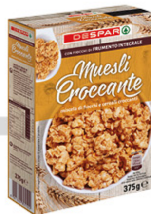
Muesli croccante Despar 375g