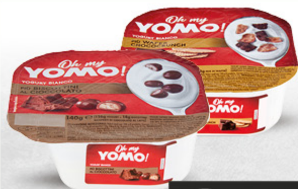
YOGURT OH MY YOMO MIX VARI TIPI 140G