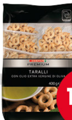
Tarallini Premium classici 40g x 10