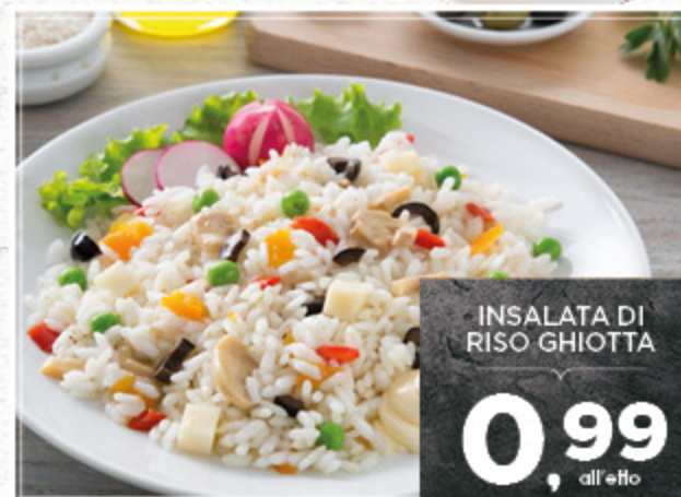
INSALATA DI RISO GHIOTTA