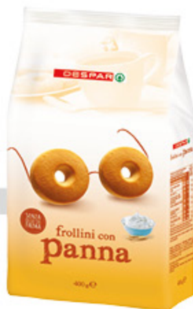
frollini despar con panna 400g