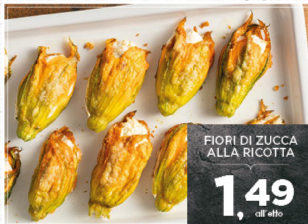
FIORI DI ZUCCA ALLA RICOTTA