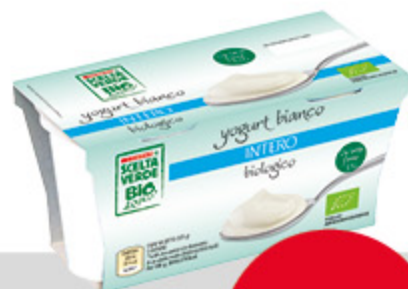
yogurt bianco intero biologico 125g x 2