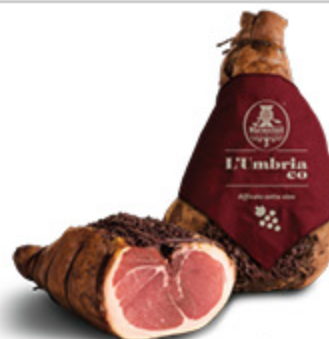
PROSCIUTTO CRUDO NAZIONALE L'UMBRIACO RENZINI