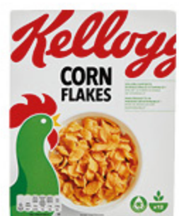
CORN FLAKES KELLOGG'S 375G