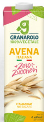
BEVANDA ALL' AVENA SENZA ZUCCHERI GRANAROLO 1L