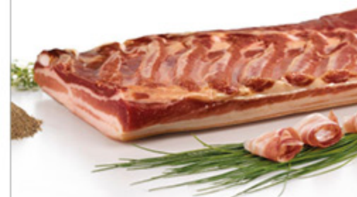
PANCETTA TESA DOLCE INTERA SALUMIFICIO SORRENTINO