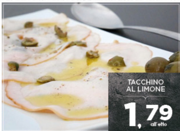
TACCHINO AL LIMONE