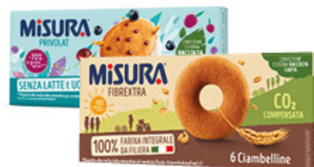
TORTINE PRIVOLAT MISURA 290G/ CIAMBELLINE INTEGRALI MISURA FIBREXTRA VARI TIPI 230G