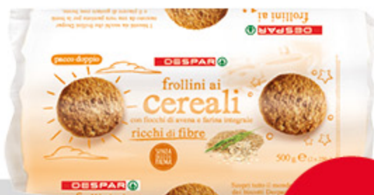
Frollini ai cereali DESPAR 500g