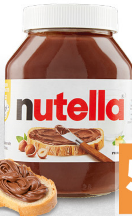
NUTELLA FERRERO 950G