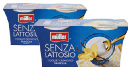
YOGURT MULLER SENZA LATTOSIO FRAGOLA/ VANIGLIA/BIANCO 125G X2