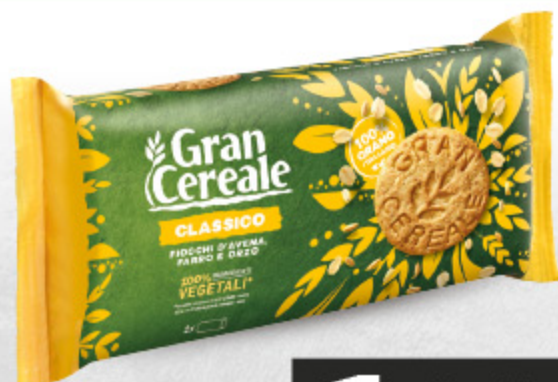
GRAN CEREALE CLASSICO 500G