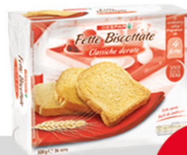
Fette biscottate DESPAR classiche dorate 320g