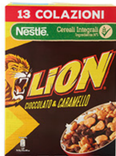
CEREALI LION CIOCCOLATO & CARAMELLO 400G