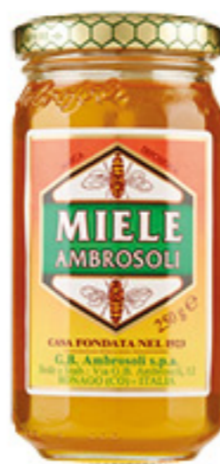
MIELE AMBROSOLI 250G