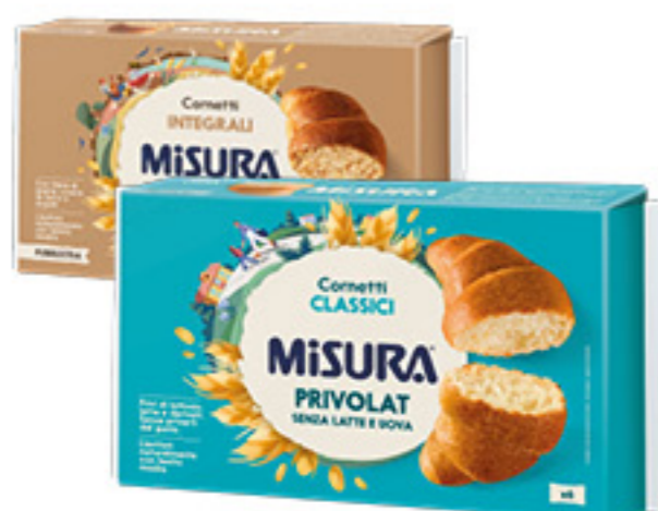
CORNETTI MISURA PRIVOLAT/ INTEGRALI X6 - 246G