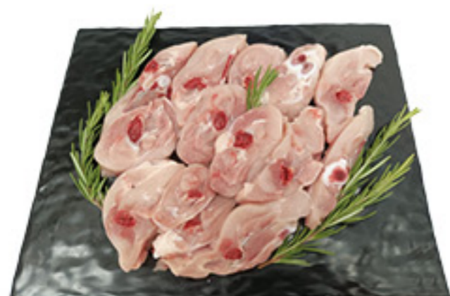
COSCE DI POLLO PER ARROSTO AL KG