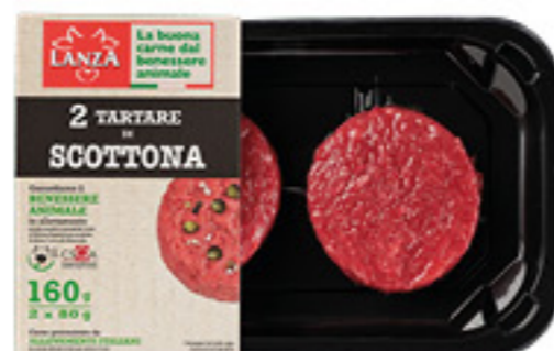
TARTARE DI SCOTTONA (BOVINO ADULTO) SKIN LANZA 80G X2