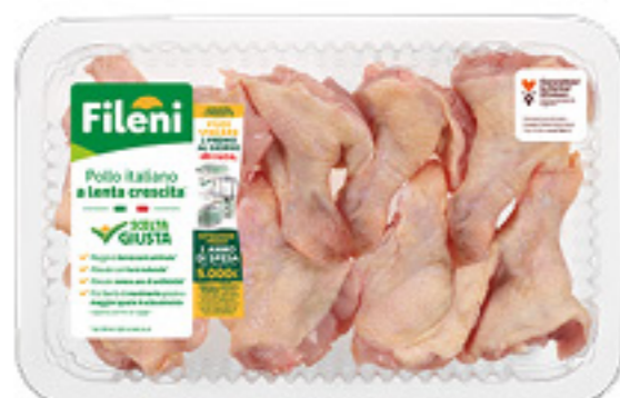
ALETTE DI POLLO DELIZIOSE FILENI AL KG