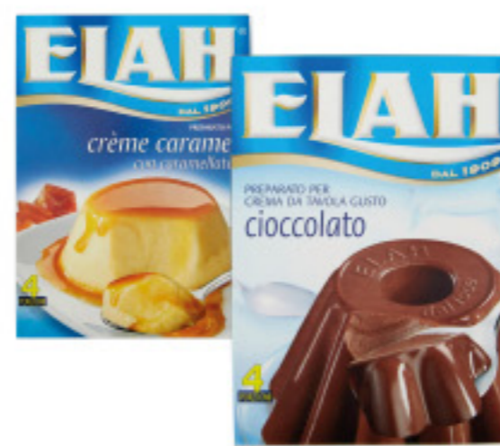
BUDINO ELAH VARI TIPI 70G-100G