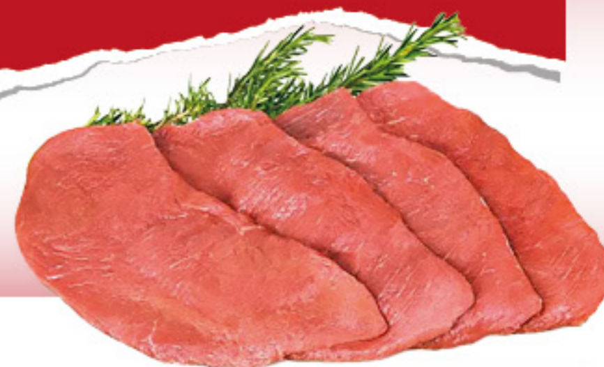
FETTINE DI BOVINO ADULTO PER COTOLETTE AL KG