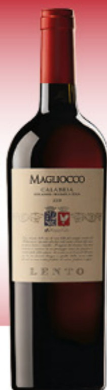
VINO MAGLIOCCO CALABRIA IGT LENTO 75CL