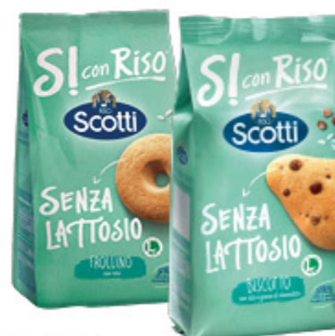
BISCOTTI/ FROLLINI SCOTTI SI CON RISO VARI TIPI 200/350G