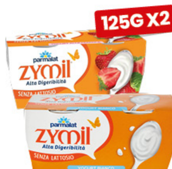
YOGURT SENZA LATTOSIO ZYMIL VARI GUSTI 125G X2