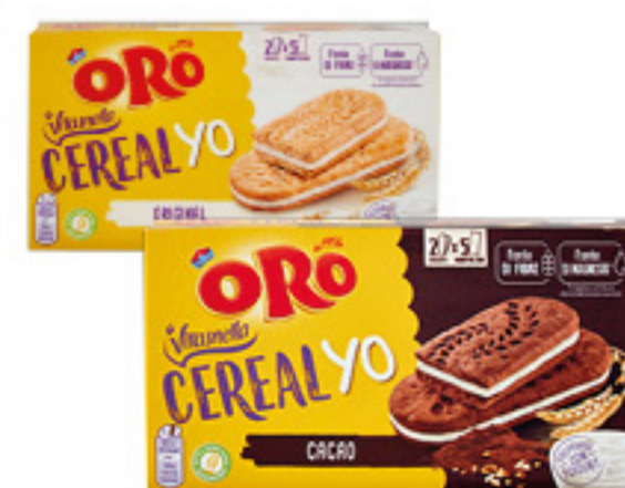
CEREAL YO VITASNELLA CACAO/ ORIGINAL/FRUTTI ROSSI 253G