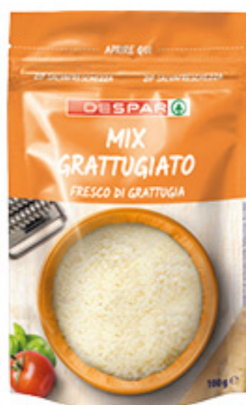
FORMAGGIO DESPAR MIX GRATTUGIATO 100G