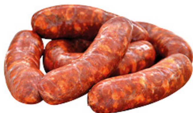
SALSICCIA FRESCA DOLCE DI SUINO AL KG