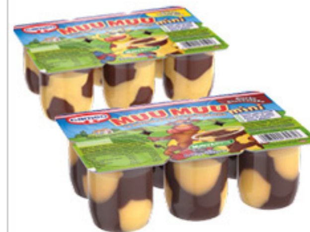
MU MU MINI CAMEO CIOCCOLATO/ VANIGLIA 50G X6