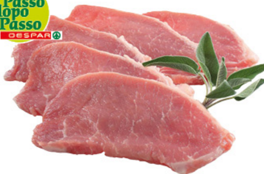
LONZA DI SUINO A FETTE DESPAR PASSO DOPO PASSO AL KG