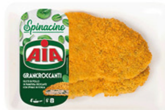
SPINACINE GRANCROCCANTI AIA 300G