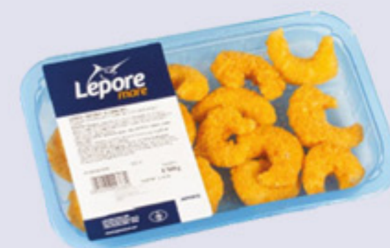
GAMBERI CROCCANTI AI CORNFLAKES 180G