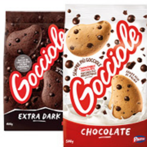
GOCCIOLE PAVESI CHOCOLATE 500G/ EXTRA DARK 400G