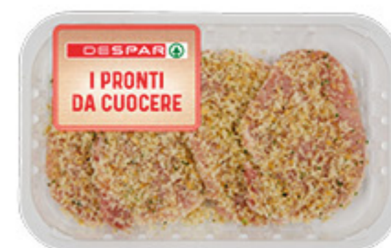
SCALOPPA DI SUINO IMPANATA DESPAR AL KG