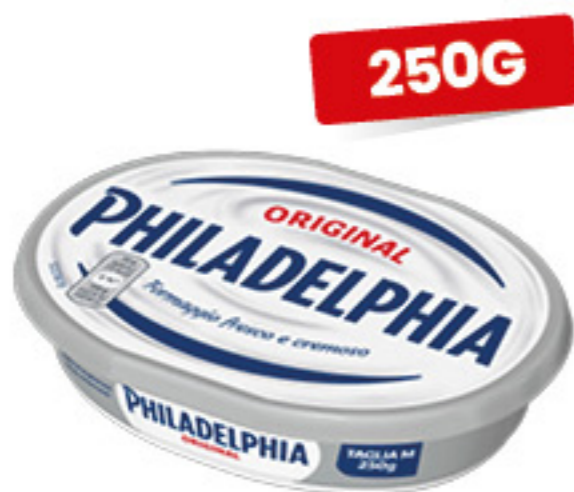
PHILADELPHIA CLASSICA 250G