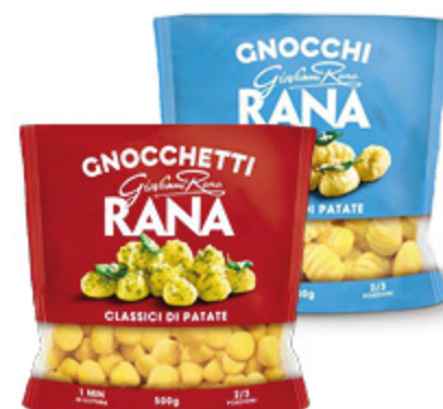
GNOCCHI/GNOCCHETTI CLASSICI DI PATATE RANA 500G