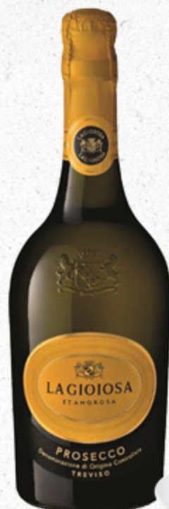
PROSECCO TREVISO DOC LA GIOIOSA ETAMOROSA 75CL

Dalla cremosità eccezionale ed un gusto autentico. Prodotta con ingredienti selezionati, valorizza ogni piatto, rendendo speciale ogni momento dedicato alla cucina fresca e di qualità.