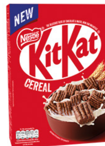
CEREALI KIT KAT 330G