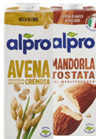
BEVANDA ALPRO VARI TIPI 1L