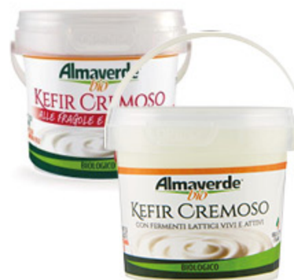
KEFIR CREMOSO ALMAVERDE BIO VARI GUSTI 150G