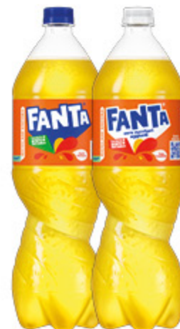
FANTA/SPRITE VARI TIPI 1,5L