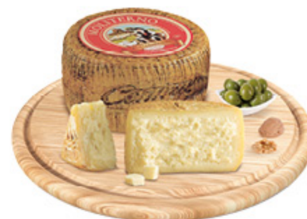
PECORINO MOLITERNO ALL'ETTO