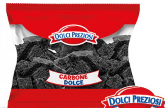
CARBONE DOLCI PREZIOSI DOLCE 100G