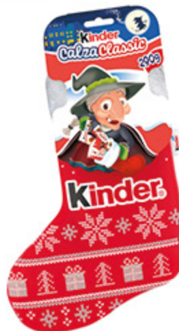
CALZA KINDER CLASSIC 290G