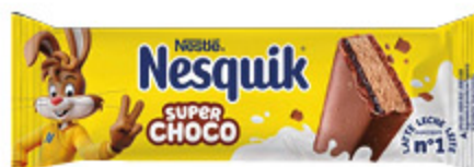
SUPER CHOCO NESQUIK 28G X4