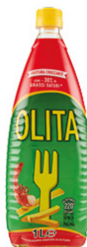
OLIO DI SEMI DI GIRASOLE OLITA 1L