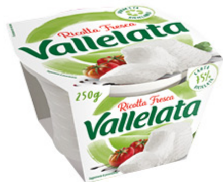
RICOTTA FRESCA VALLELATA 250G