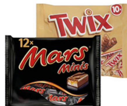
MARS/SNICKERS/ TWIX MINIS 227G