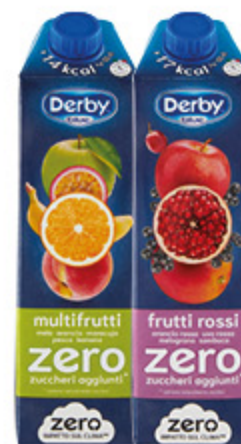
SUCCO DERBY BLUE ZERO ZUCCHERI AGGIUNTI VARI GUSTI 1L