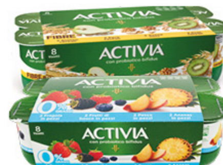
ACTIVIA GUSTI ASSORTITI X8 125G