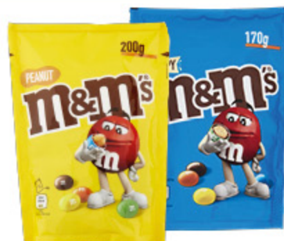
M&M'S CRISPY/ CHOCOLATE/ PEANUT 170G/200G