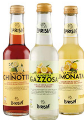
BIBITE LURISIA CHINOTTO/ ARANCIATA/ GAZZOSA/ LIMONATA 275ML