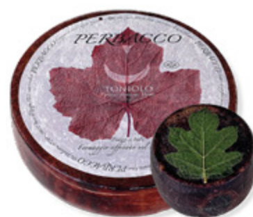
FORMAGGIO IMBRIAGO PERBACCO ALL'ETTO