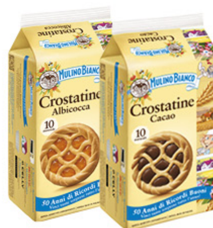
CROSTATINE MULINO BIANCO CACAO/ALBICOCCA X10 400G