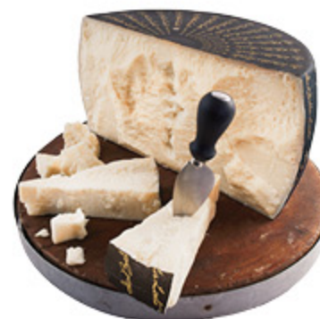
FORMAGGIO BELLA LODI ALL'ETTO