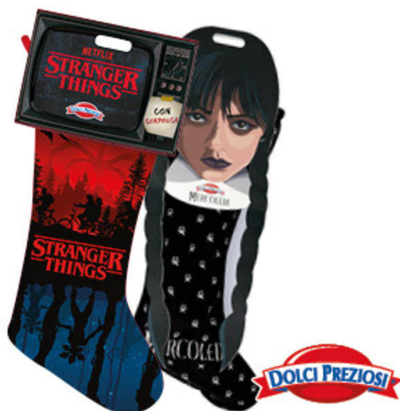
CALZE DOLCI PREZIOSI VARI PERSONAGGI 190G