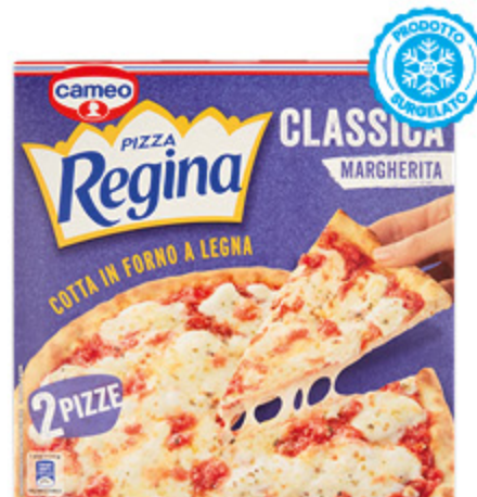
PIZZA CLASSICA MARGHERITA REGINA CAMEO 620G