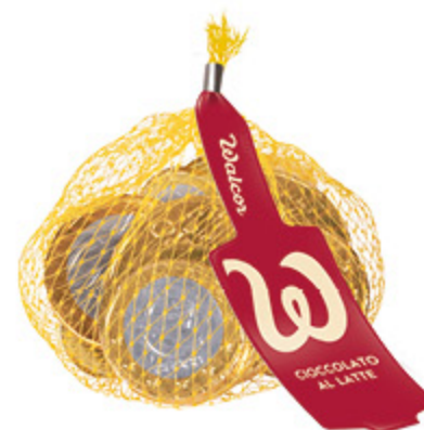
RETINA DI MONETE DI CIOCCOLATO WALCOR 25G