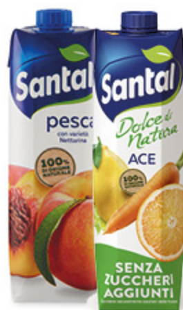
SUCCHI SANTAL VARI TIPI 1L