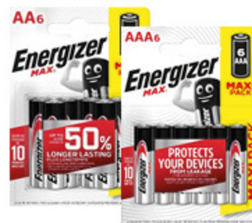
PILE MINISTILO MAX/STILO MAX ENERGIZER 6PZ