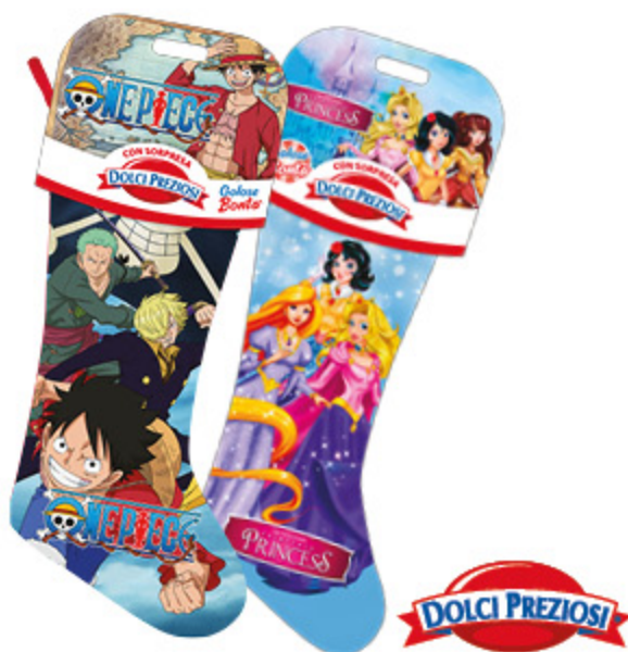
CALZE DOLCI PREZIOSI VARI PERSONAGGI 170G