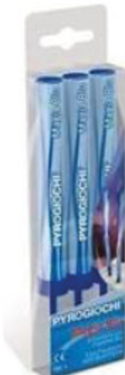
CANDELE A FONTANA CON SUPPORTO GABBIANO X3