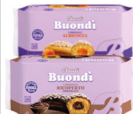
BUONDI BAULI CIOCCOLATO/ ALBICOCCA/CACAO X6 258G/276G