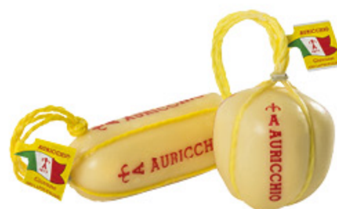
PROVOLETTA AURICCHIO GIOVANE ALL'ETTO