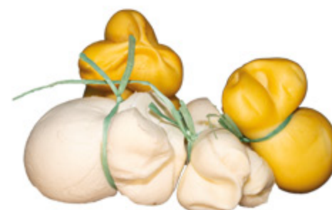
SCAMORZA DELIZIOSA BIANCA/PASSITA ALL'ETTO