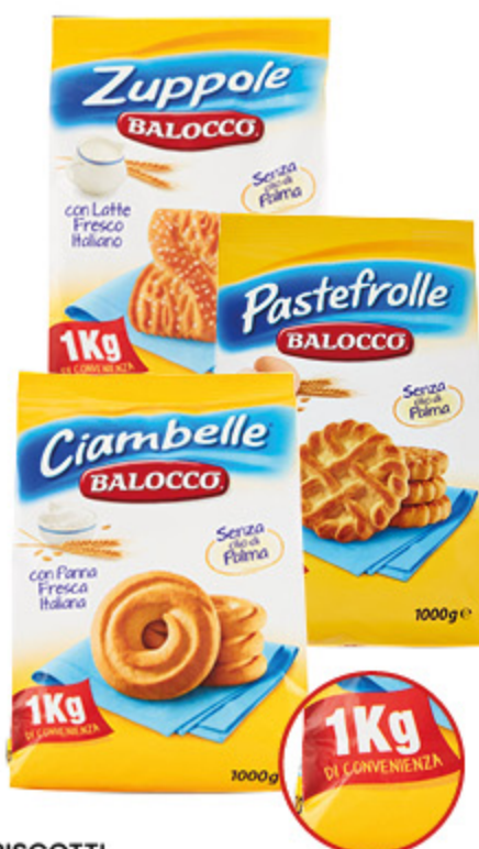
BISCOTTI BALOCCO CIAMBELLE/ ZUPPOLE/ PASTEFROLLE 1KG