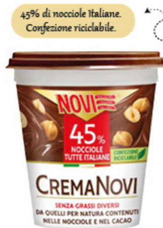
CREMA NOVI 200G