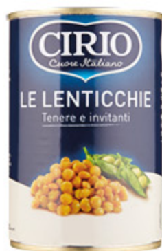
LENTICCHIE CIRIO 410G