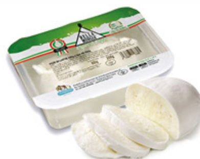
FIOR DI LATTE/NODO DI MOZZARELLA/TRECCIA BELLA MURGIA 200G