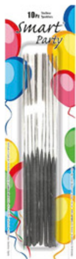
STELLINE SMART PARTY 18CM X10