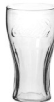
BICCHIERE COCA COLA IN VETRO TRASPARENTE 37CL