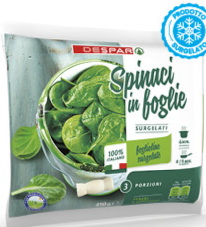
SPINACI IN FOGLIA DESPAR 450G