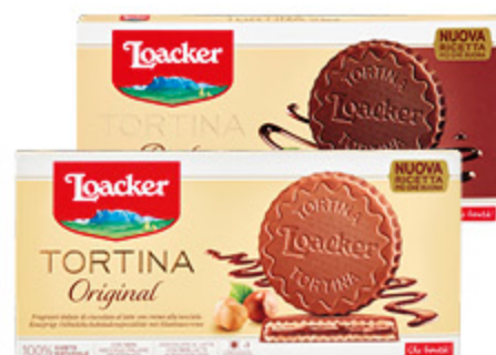
TORTINA LOCKER DARK/ORIGINAL 21G X3