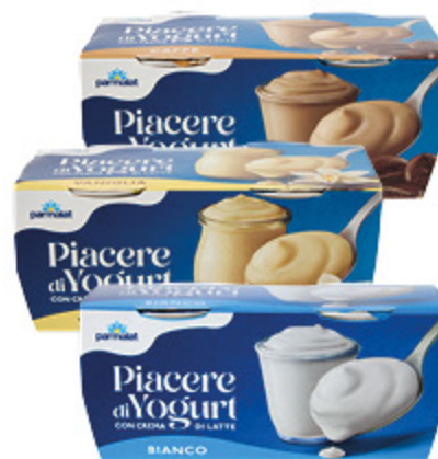
PIACERE DI YOGURT PARMALAT VARI GUSTI 115G X2