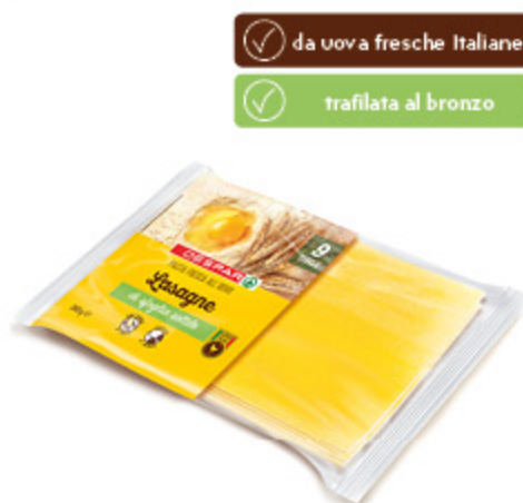
LASAGNE ALL'UOVO DA SFOGLIA SOTTILE DESPAR 250G