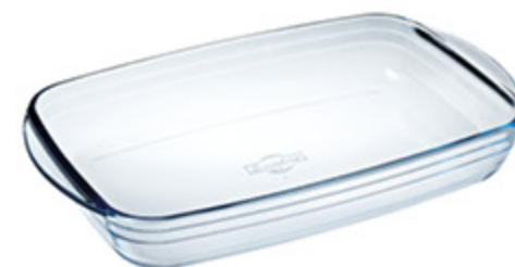
TEGAME ARCUISINE RETTANGOLARE IN VETRO 33X20