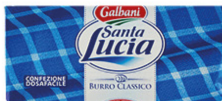
BURRO SANTA LUCIA GALBANI 250G