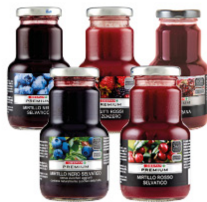
NETTARE DESPAR PREMIUM VARI GUSTI IN VETRO 20CL