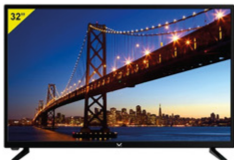
TV SMART MAJESTIC LED HD READY 32"