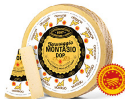
MONTASIO DOP ALL'ETTO