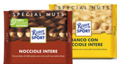
TAVOLETTE DI CIOCCOLATO RITTER SPORT VARI TIPI 100G