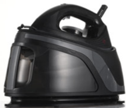
FERRO DA STIRO ZEPHIR A VAPORE 2250W 13L