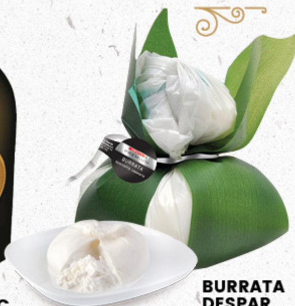
BURRATA DESPAR PREMIUM IN FOGLIA ALL'ETTO