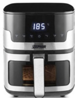
FRIGGITRICE AD ARIA ZEPHIR ACCIAIO 5,5L