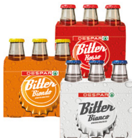
BITTER DESPAR BIANCO/ROSSO/ BIONDO 100ML X6