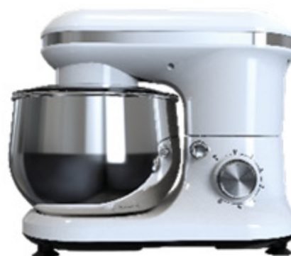
IMPASTATRICE PLANETARIA ZEPHIR DELUXE 1000W