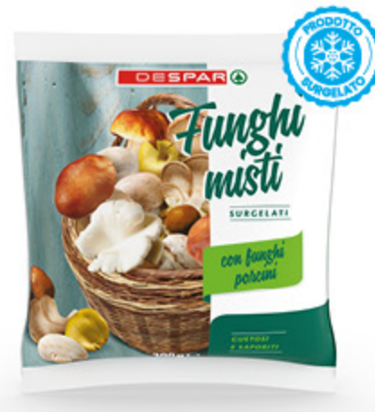
FUNGHI MISTI DESPAR 300G