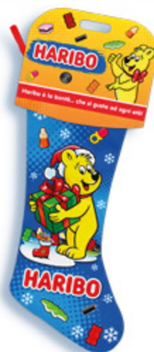
CALZA HARIBO 228G