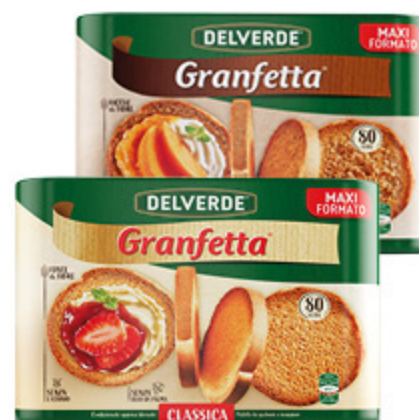
GRANFETTE DELVERDE CLASSICHE/ INTEGRALI X80 600G