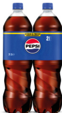
PEPSI 1,5L X2