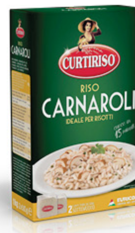
RISO CARNAROLI CURTIRISO 1KG