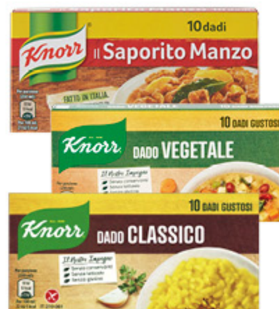
DADI KNORR VARI TIPI X10