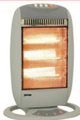
STUFA ZEPHIR ALOGENA 1200W