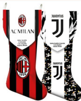
CALZE ICAM JUVENTUS/ INTER/MILAN 140G