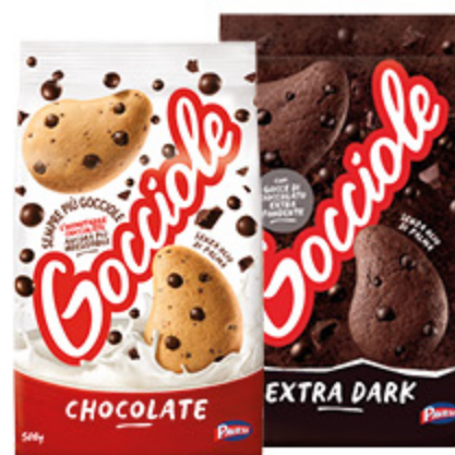
GOCCIOLE PAVESI CHOCOLATE 500G/ EXTRA DARK 400G