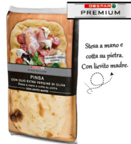
PINSA DESPAR PREMIUM 230G X2