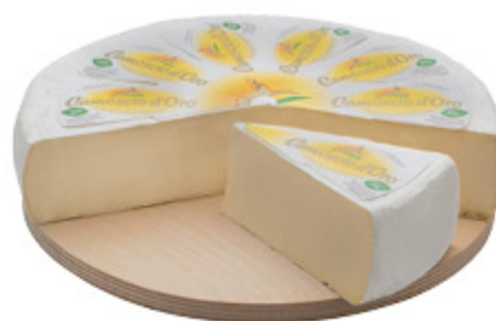
FORMAGGIO CAMOSCIO D'ORO ALL'ETTO