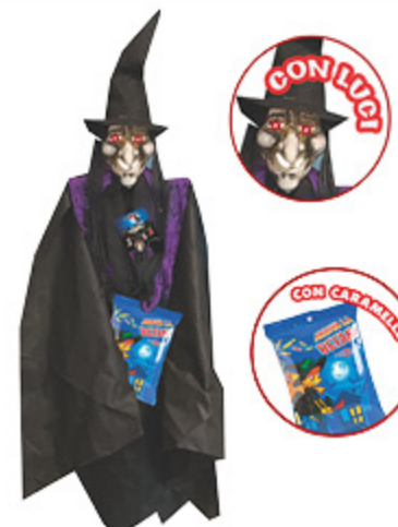
BEFANA CON LUCI CASTELVEDERE 150G