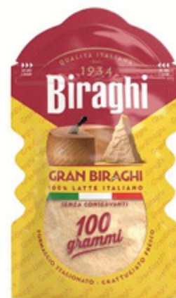
FORMAGGI BIRAGHI GRATTUGIATO 100G