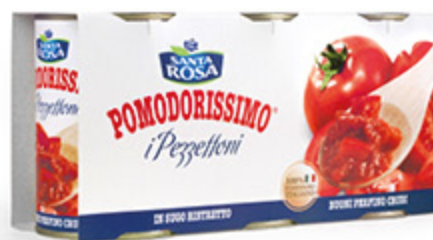
I PEZZETTONI SANTA ROSA POMODORISSIMO 400G X3