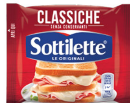
SOTTILETTE CLASSICHE 200G