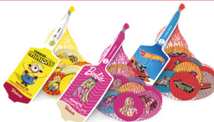
RETINA DI MONETE DI CIOCCOLATO WALCOR MINIONS/BARBIE/ HOTWHEELS 45G