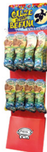
CALZA DA RIEMPIRE DYNIT BOY/GIRL