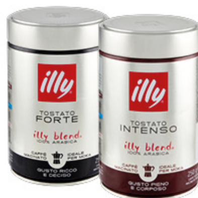
CAFFÈ MACINATO ILLY FORTE/CLASSICO/ INTENSO 250G