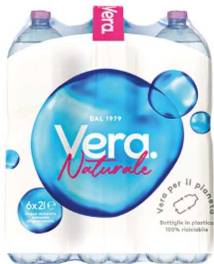
ACQUA MINERALE NATURALE VERA 2L X6