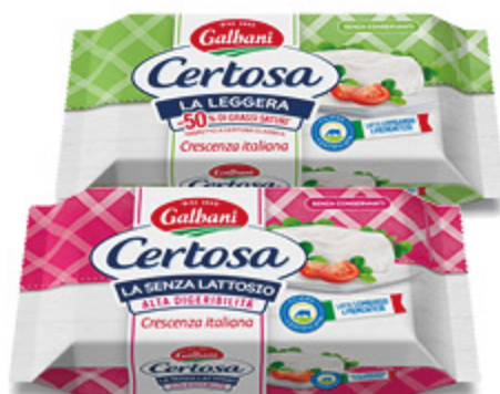
CERTOSA GALBANI LA LEGGERA/ LA SENZA LATTOSIO 165G