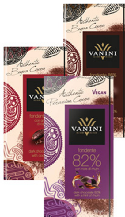
TAVOLETTE DI CIOCCOLATO VANINI VARI TIPI 100G