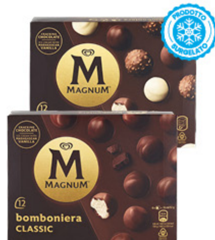
BOMBONIERA MAGNUM VARI TIPI 104G