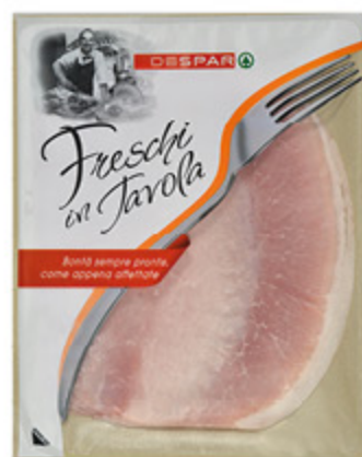
PROSCIUTTO COTTO DESPAR FRESCHI IN TAVOLA 120G