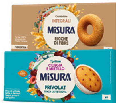
TORTINE/ CIAMBELLINE MISURA VARI TIPI 230/290G