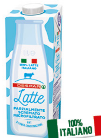
LATTE UHT DESPAR PARZIALMENTE SCREMATO MICROFILTRATO 1L