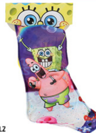
CALZ RIEMPIRE BURAGO/ SPONGEBOB/ TURTLES DYNIT