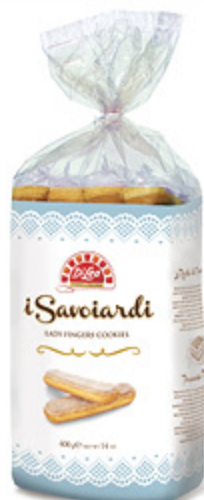
SAVOIARDI DI LEO 400G