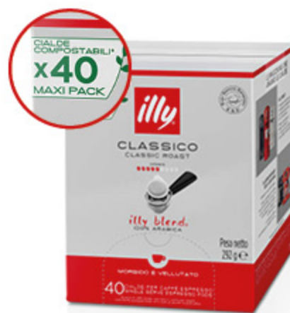
CAFFÈ IN CIALDE ILLY CLASSICO X40